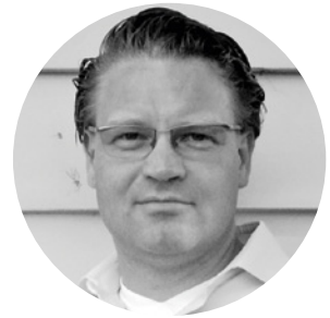
Design: Andreas Krob