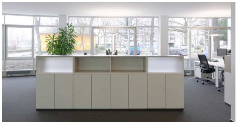
Praktisch und raumgliedernd – die Stauraumelemente K2.