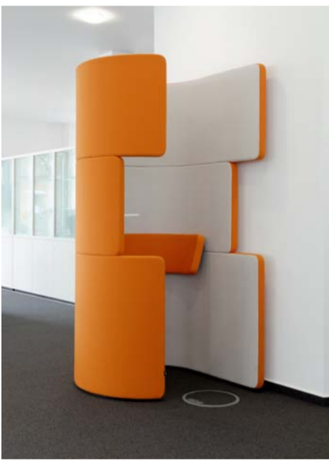
In der Phone Booth lässt sich ungestört telefonieren.