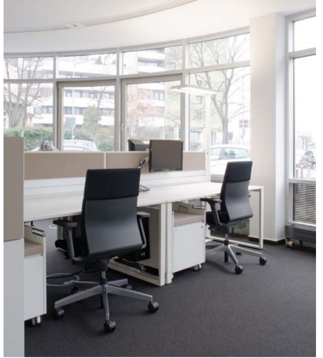
Komfort, helle Farben und mobiler Stauraum prägen die Arbeitsplätze.