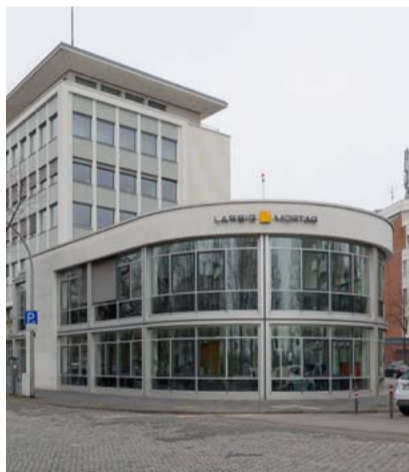
Harmonisch auch von außen.

Adresse Theodor-Heuss-Ring 23, 50668 Köln Branche Immobilien Größe 14 Arbeitsplätze, 24,00 lfm Wand Produkte T-Front Office, T-Workstation, T-Workbench, 3L Dritte Arbeitsebene, Filo Table, K2 Stauraum, KB Box, T-Caddy, KT Sideboard, R-Plattform, DOCKLANDS Dock-In Bay, DOCKLANDS Phone Booth, RG Ganzglaswand, PARCS Causeway, PARCS Cylinder Table, PARCS Storage, Bay Chair, B_Run, Arper, Artemide, Brunner, Carpet Concept, Cascando, Humanscale, Wilkhahn Bene Spectrum Industrial, Spice