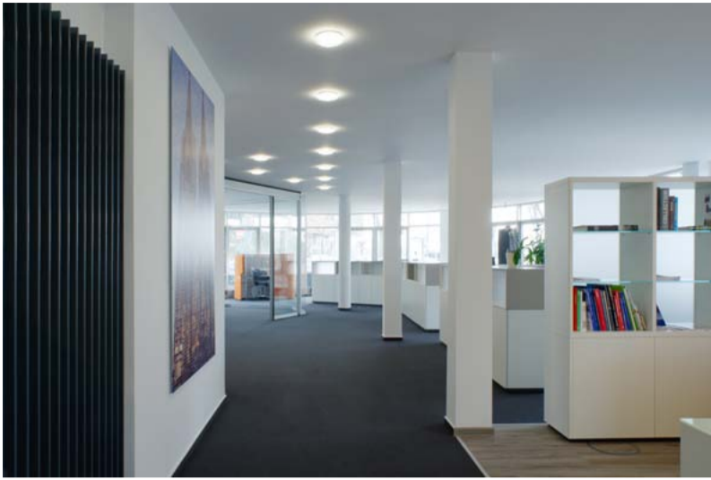
Die Bürolandschaft bietet Raum zur Entfaltung.